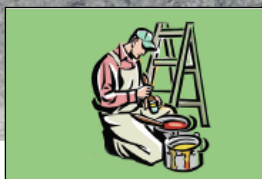
Entreprises de peinture Prestataires BTP