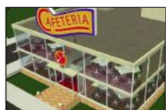
CHR (Café Hôtel Restaurant)