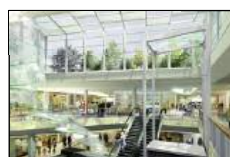
ERP (Etablissement Recevant du Public)