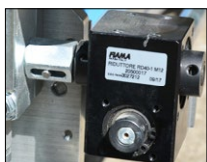
Nouvelle vanne de mélange