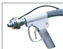
Pistolet H 2 O + Tuyau