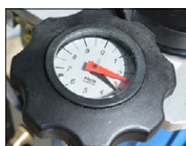
Cadran de réglage