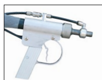
Pistolet HELIX + Tuyau