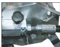
Système QUICK CONNECT