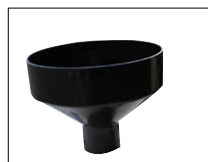
Entonnoir de remplissage