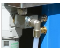
Vanne d'échappement rapide