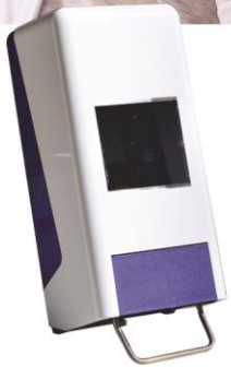
Utilisable avec DISTRICOAT NM