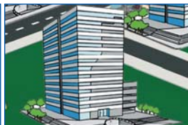
Immeubles / HLM