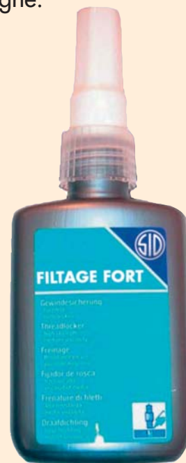
Flacon de 50g