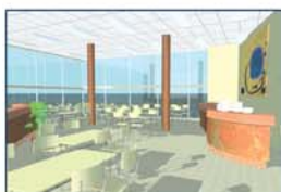
Hôtels / Restauration