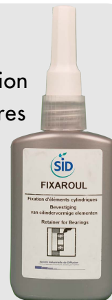
Flacon de 50g

FIXAROUL permet d'atteindre un taux de portance de 100% et ainsi d'obtenir l'étanchéité vis-à-vis des gaz ou des fluides.