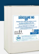
DEROXANE NG GEL