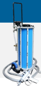
BICARBONATE en hydro