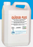
OLEOSID PLUS Traitement moyen terme