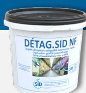
DETAG.SID NF Lingettes