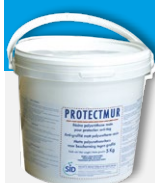
PROTECTMUR Traitement longue durée