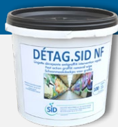
DETAG.SID NF Lingettes