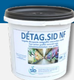
DETAG.SID NF Lingettes