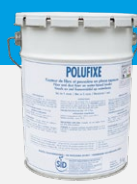
POLUFIXE Traitement moyen terme