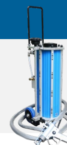
BICARBONATE en hydro