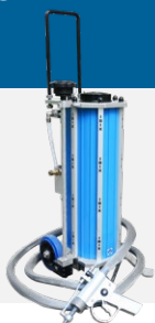
BICARBONATE en hydro