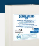
DEROXANE NG GEL