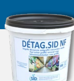
DETAG.SID NF Lingettes