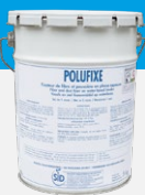
POLUFIXE Traitement moyen terme