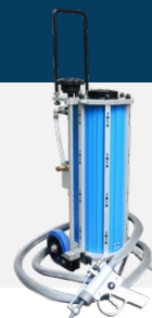
GREINAGOM GLASSGOM 90-150