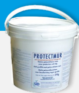
PROTECTMUR Traitement longue durée